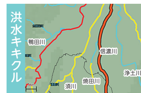
(令和元年 台風19号豪雨時の長岡市の状況)