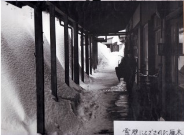
雪壁にこぼされた廊下