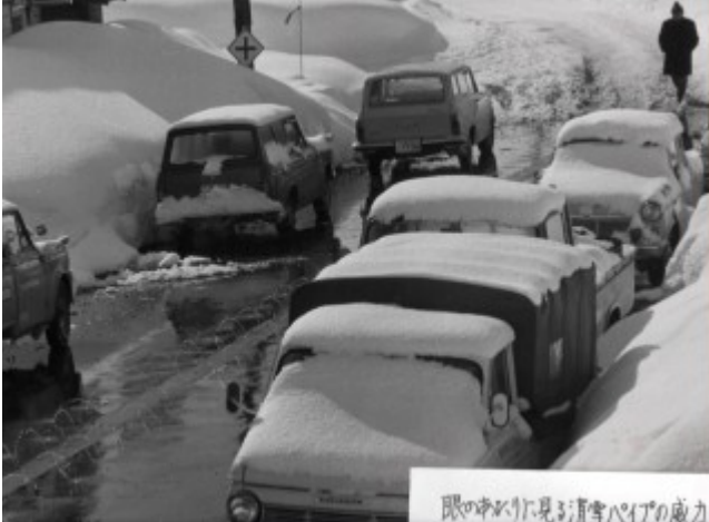
眼の中だけに見る清雪パイプの威力