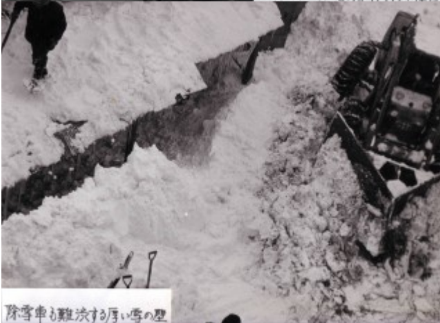
除雪車も難攻する厚い雪の壁