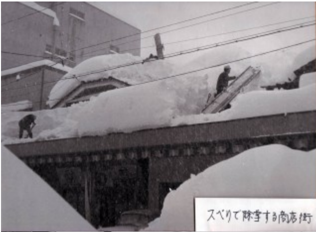
スベリて除雪する商店街