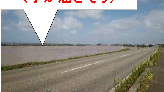
信濃川 (手が届きそう)