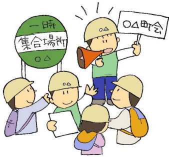
強いリーダーシップ