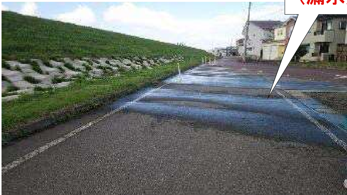
中瀬側の 栖吉川土手 (漏水)